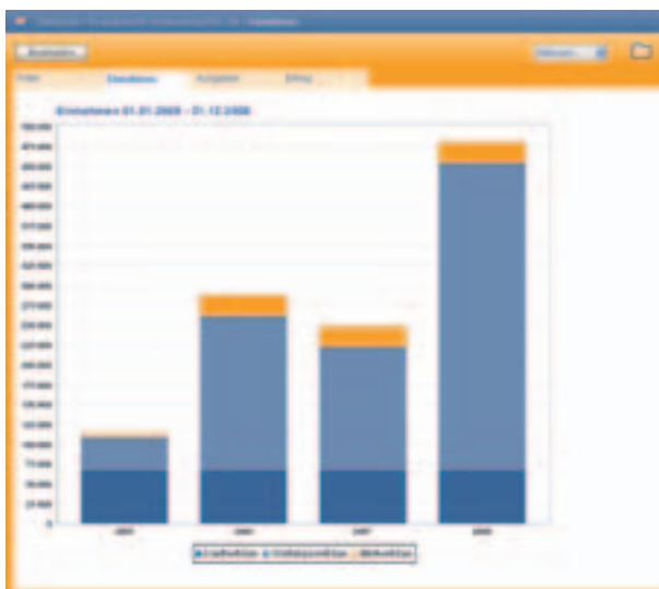
Einnahmen ausgewählter Vertragstypen als grafische Auswertung